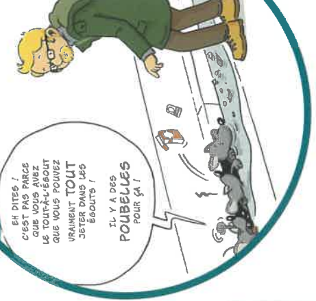
Méli Mélo - Dégâts des fils de l'eau