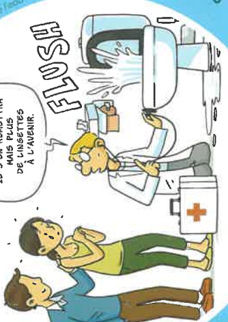
Méli Mélo - Dégâts des fils de l'eau

INDIGESTION CLASSIQUE... IL S'EN REMETTRA MAIS PLUS DE LINGETTES À L'AVENIR.