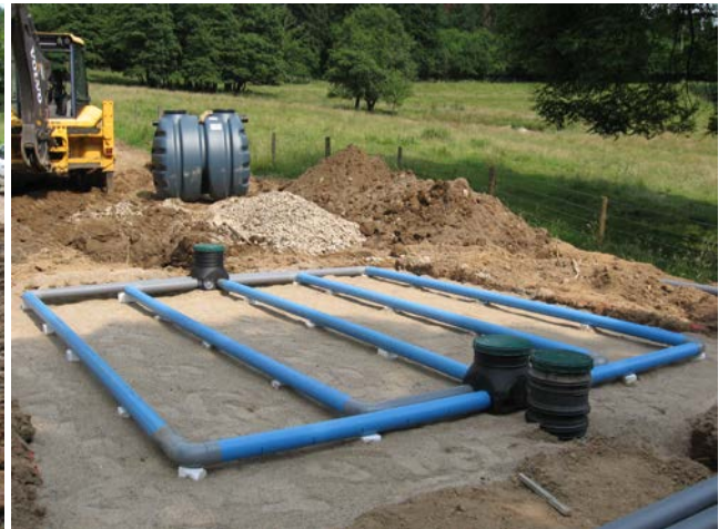
Photos illustrant la réalisation d'une installation d'assainissement non collectif par technique de filtre à sable.